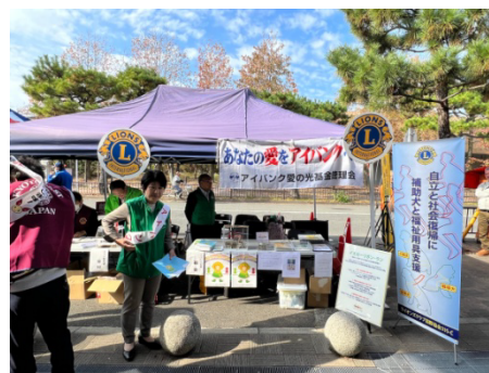
2R合同献血・アイバンクキャンペーン