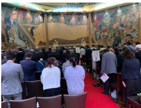
第26回 愛の光 感謝の集い