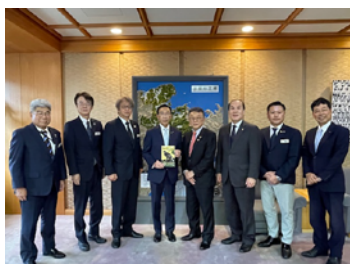
2024年7月1日 京都府知事 西脇隆俊 様