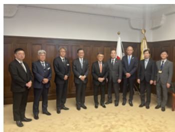
2024年7月1日 京都市長 松井孝治 様