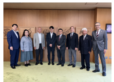
2024年7月11日 奈良県知事 山下 真 様