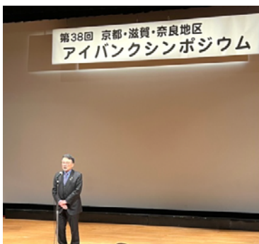
第38回アイバンクシンポジウム