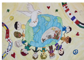
四方 最盛 様 福知山市立昭和小学校 6年