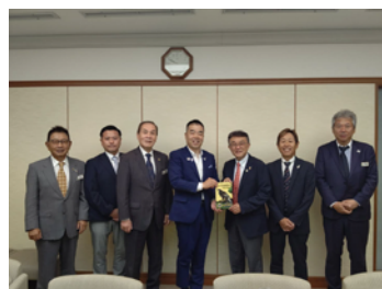
2024年7月8日 滋賀県知事 三日月大造 様