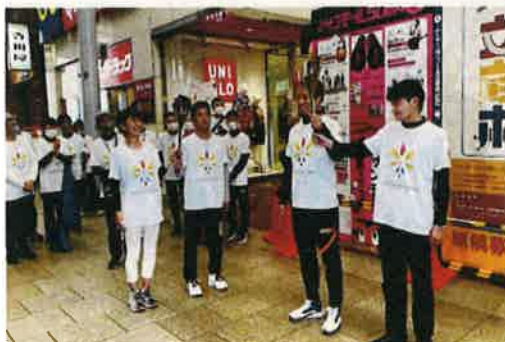
第1走者から第2走者へ