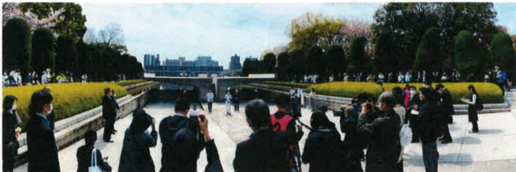
有森大会会長 挨拶