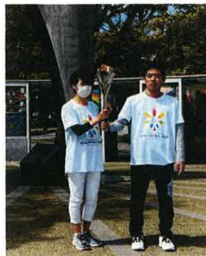
ランタンからトーチへ