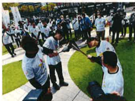
第2走者から第3走者へ