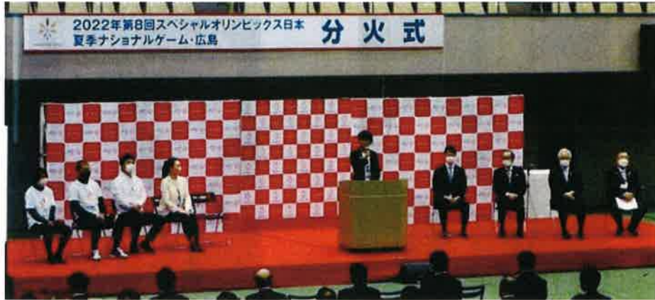
有森裕子大会会長挨拶