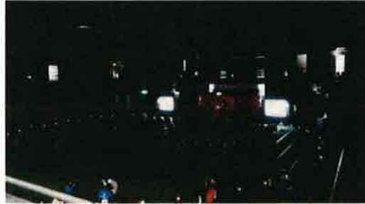
各地区組織には大会火を囲んで大きな円となり 47 地区組織に分火しました