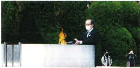
松井一寛広島市長「平和の灯(ともしび)」採火