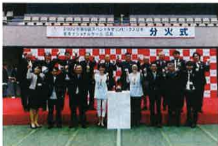
有森大会会長、崔実行委員長、ご来賓の方々、 大会サポーター様、スポンサー様